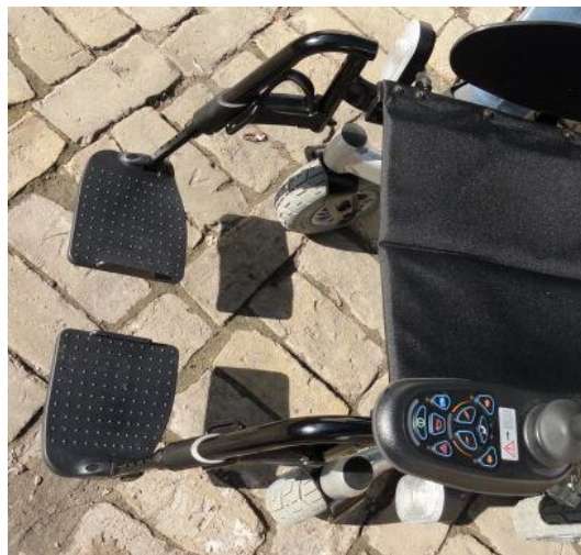
2. ábra A szék lábtartója 2 lapátból áll, ami kényelmetlenséget okoz

Másik problémája a széssel, hogy annak lábtartó része 2 különálló lapátból áll, de hosszabb utazás után becsúszik a lába a 2 lapát közé. Olyan lábtartót szeretne, ami csak egy lapátos, megakadályozva ezzel az esetleges baleseteket.