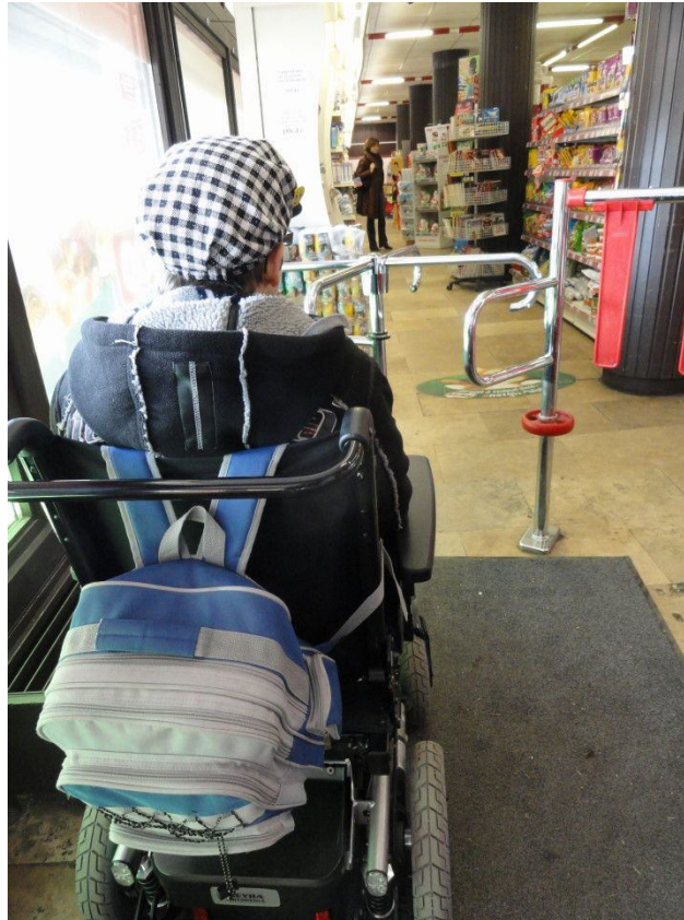
4. ábra Átjutni egyedül lehetetlen

kisboltban és üzletben található forgó kapu, amely lehetetlenné teszi a bejutást számukra. Ezt egyedül kivenni képtelenek, átférni nem tudnak, az eladó segítségét kell kérniük.