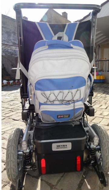
1. ábra A csomagtartó hiányát sokszor tapasztalja

Másik problémája a széssel, hogy annak lábtartó része 2 különálló lapátból áll, de hosszabb utazás után becsúszik a lába a 2 lapát közé. Olyan lábtartót szeretne, ami csak egy lapátos, megakadályozva ezzel az esetleges baleseteket.